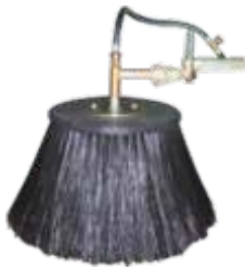
KIT CAMPANULA ANTI-DERIVA D.60 KIT CAMPANULA ANTI-DRIFTING D.60 KIT CAMPÂNULE ANTI-DERIVE D.60 KIT CAMPANA ANTI-DERIVA D.60