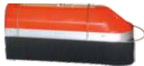
CAMPANULA C/PROTEÇÃO ANTI-DERIVA CAMPANULA C/PROTECTION ANTI-DRIFTING CAMPÂNULE AVEC PROTECTION ANTI-DERIVE CAMPANA C/ PROTECCIÓN ANTI-DERIVA