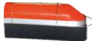
CAMPANULA C/PROTEÇÃO ANTI-DERIVA CAMPANULA C/PROTECTION ANTI-DRIFTING CAMPÂNULE AVEC PROTECTION ANTI-DERIVE CAMPANA C/ PROTECCIÓN ANTI-DERIVA