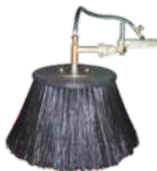
KIT CAMPANULA ANTI-DERIVA D.60 KIT CAMPANULA ANTI-DRIFTING D.60 KIT CAMPÂNULE ANTI-DERIVE D.60 KIT CAMPANA ANTI-DERIVA D.60