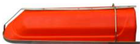
CAMPÂNULA BELLFLOWER CAMPANULE CAMPÁNULA