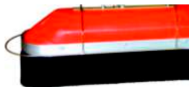
ANTI DERIVA ANTI DRIFT ANTI DÉRIVE ANTI DERIVA