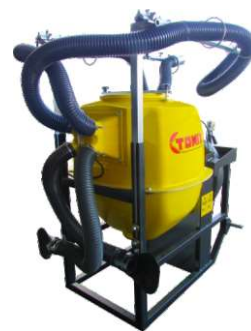
4 - SAÍDAS VINHA 4 - EXITS GRAPE VINES 4 - SORTIES VINEYARDS 4 - SALIDAS VIÑEDOS