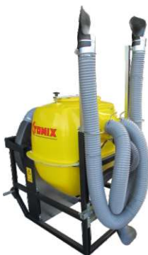
3 - SAÍDAS 3 - EXITS 3 - SORTIES 3 - SALIDAS