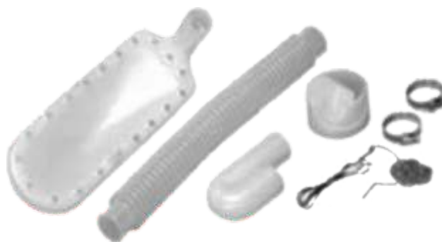
KIT PARA PÓ KIT FOR DUSTING KIT POUR POUDDRE KIT PARA POLVO