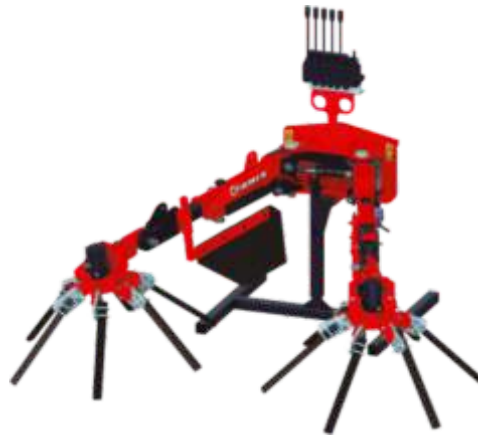
VARREDOURA COM KIT NYLATRON SWEEPER WITH KIT NYLATRON BALEYEUSE AVEC KIT NYLATRON BARREDORA CON KIT NYLATRON